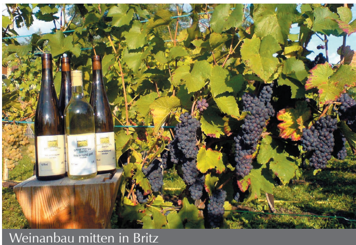
Weinanbau mitten in Britz

Der Eintritt ist natürlich frei! Weininteressierte sind herzlich eingeladen einmal selbst die Reben zu beschneiden. Das Weingut liegt im Koppelweg 70 (Bus 181 Haltestelle Am Brandpfuhl; Bus M44 Britzer Damm/ Mohriner Allee). www.britzer-weingut.de ■