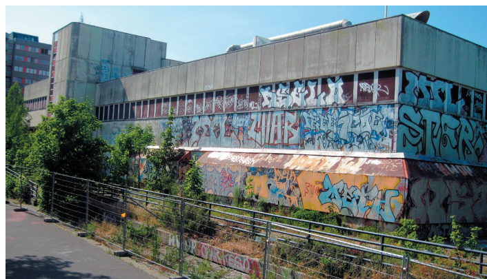
Asbestruine ehem. Leonardo-da-Vinci-Oberschule Buckow: Abriss und Neubau kann sofort beginnen!

Zwingend für die Stabilisierung der Nord-Neuköllner Situation erforderlich, allerdings oftmals problematisch aufgrund von notwendigem Grunderwerb.